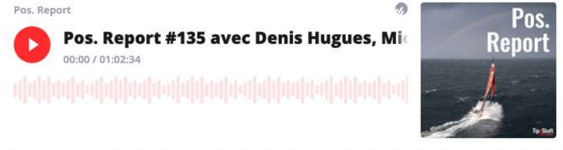
Exemple de média original : Podcast Tip&Shaft